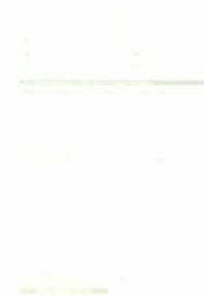
セミナーレポート