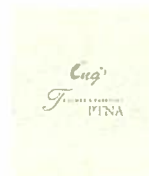
指導者パスポート