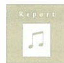
ingプログラム Reportシール